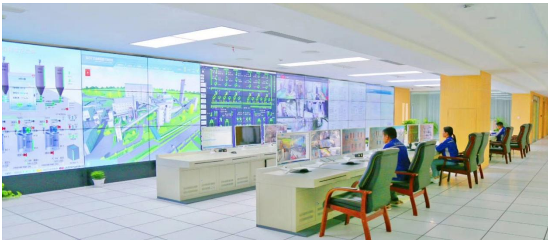
图 8 马钢矿业张庄铁矿智能集控中心实景图

近年来，张庄矿围绕建设“安全、高效、生态、智慧”矿山的 企业愿景和贯彻“机械化换人、自动化减人、智能化无人”的工作 思想。以机械化换人、自动化减人、智能化无人为发展思路，全 面推进工业化、信息化和智能化的深度融合与集成。结合张庄矿 生产工艺流程，应用自动化控制、智能化感知、大数据、人工智 能等技术对采选设备进行改造，通过生产设备的机械化、自动化、 智能化逐步替换人工操作，探索工序远程化和智能化。