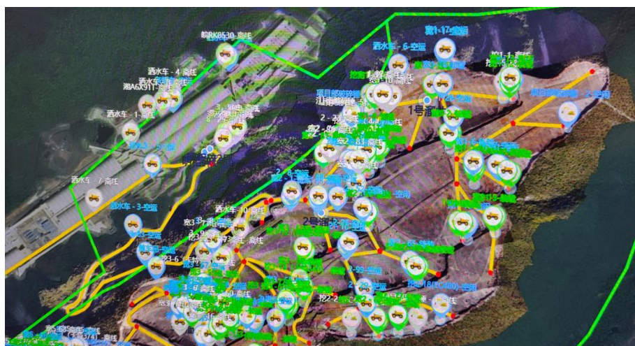
图 3 长九（神山）灰岩矿智能调度系统